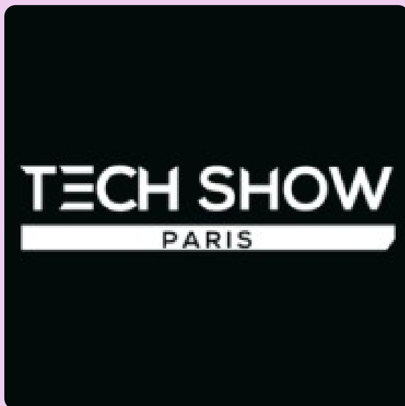
Tech Show Paris

Retrouvez-nous le 18 et 19 novembre au salon Tech Show Paris à Paris Expo - Porte de Versailles.