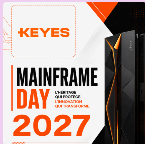
Mainframe Day 2027

Retrouvez-nous le 18 et 19 novembre au salon Tech Show Paris à Paris Expo - Porte de Versailles.